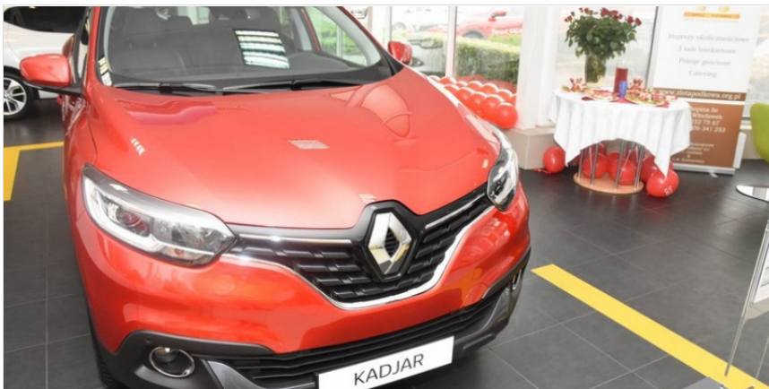
Oto nowa propozycja od Renault: Kadjar

W sobotę, 12 września odbyły się Dni Otwarte Renault Kadjar w salonie Renault Pasikowski we Włocławku. Oprócz poznania najnowszego SUV-a od Renault, można było wziąć udział w ciekawych konkursach.